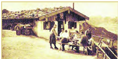
Rosenheimer Hütte (Seitenalm), 1904.