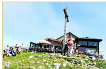
Beliebtes Ausflugsziel: Der Rosenheimer Hausberg, die Hochries.