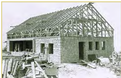
Der Natursteinbau 1958.