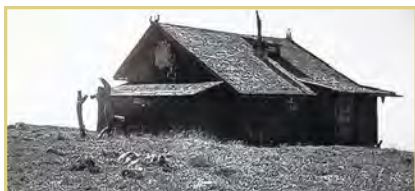
Die Skihütte auf der Hochries im Sommer 1914.