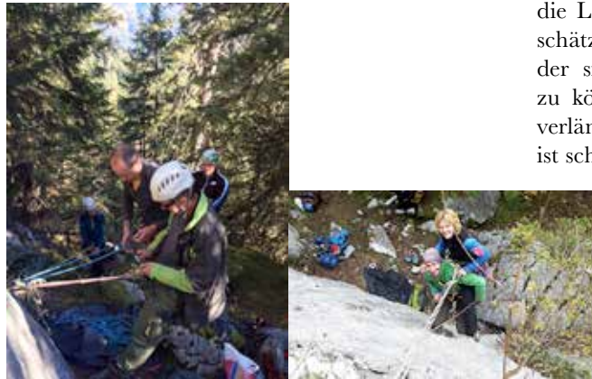
kontrolliertes Ablassen mit der magic plate

Eine weitere gefährliche Situation ergibt sich bei einer Dreier-