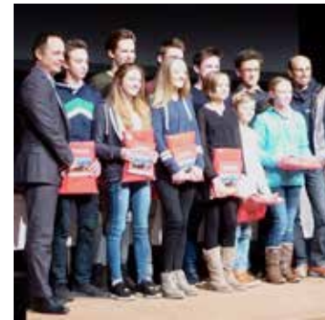
Bayerische Meister auf der Rosenheimer Sportgala

Bayerischer Titel Jugend trainiert für Olympia der Schul- mannschaft des Sebastian Finsterwal- der Gymnasiums (alles Rock&Bloc-Team- mitglieder) in beiden Altersklassen