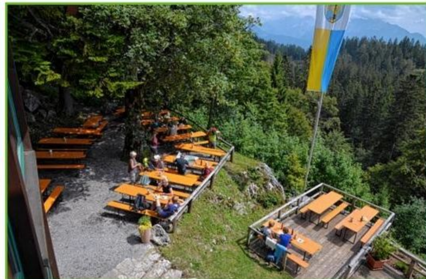
Vom Biergarten aus bietet sich ein herrlicher Blick.