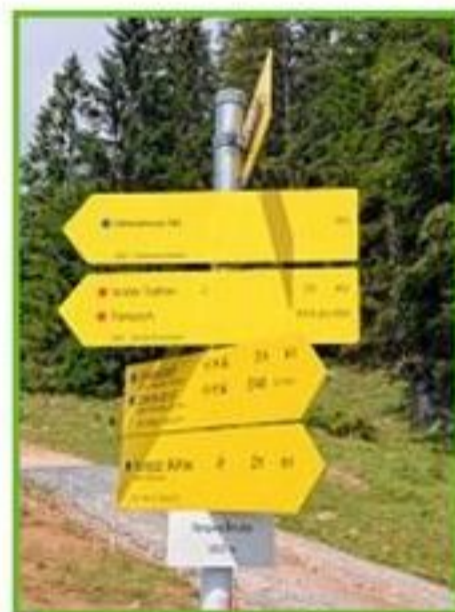
Tourenziele vom Brunnsteinhaus aus.