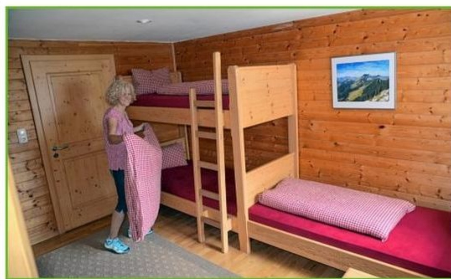
Das Brunnsteinhaus bietet 21 Betten sowie 42 Lagerplätze in schönen Zimmern.